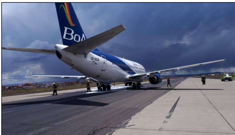
Figura 1 –Parada total y la llegada de los servicios de emergencia.

Ante esta situación, la tripulación detuvo la aeronave sobre la pista y solicitó asistencia a los servicios de emergencia del aeródromo, así como al personal de mantenimiento, como se muestra en la figura 1.