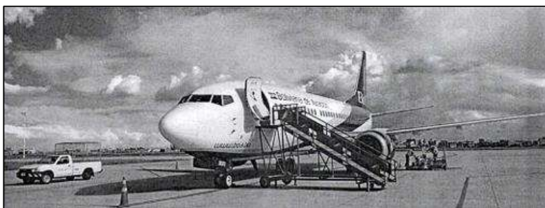
Figura 2 – Aeronave estacionada en una plataforma remota después del incidente.

Posteriormente, la aeronave fue retirada de la pista y trasladada a una plataforma remota para su evaluación técnica y acciones de mantenimiento correspondientes, como se muestra en la figura 2.