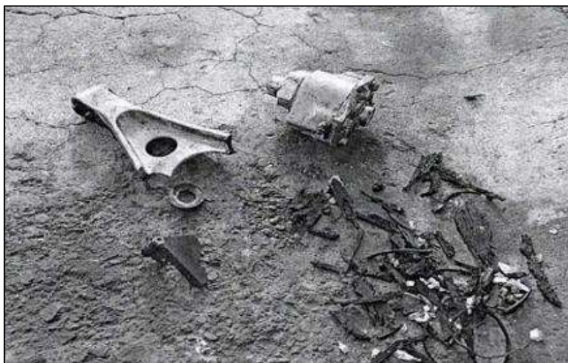
Figura 4 – Partes encontradas en la pista referente al tren principal izquierdo.